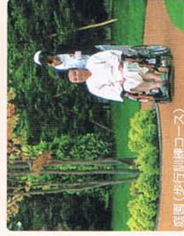
庭園（歩行訓練コース）