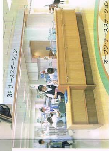
オープン・ナースステーション

最善の医療を提 供すべく、最新の 医療機器を備え る一方、院内のコ ンピュータ化に より診療の迅速 化・情報の共有化 が可能となっ ております。