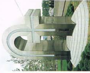
中村記念病院、記念モニュメント

札幌市中央区南1条西14丁目 TEL.231-8555 救急専用231-8333 【診療科】脳神経外科/内科/神経内科/外科/心臓血管外科/整形外科/ 麻酔科/放射線科/リハビリテーション科/耳鼻咽喉科/眼科 【外来診療時間】平日: 午前9時～午後5時/土曜: 午前9時～正午 【病床数】1504床 ■救急部の受付は24時間体制で行っています。